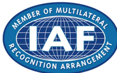
図5 IAF MLA マーク (国際登録番号:0848938)