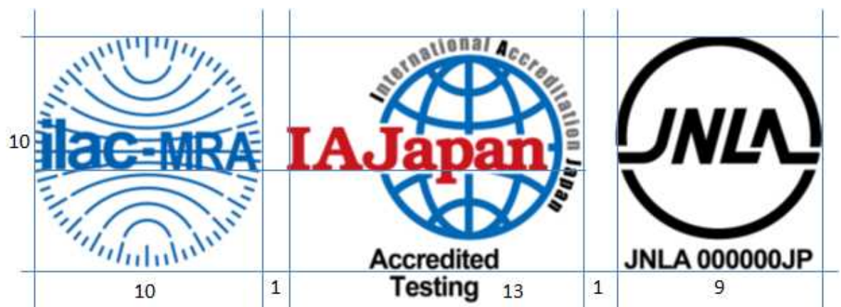
図7 JNLA/ILAC MRA 組み合わせ認定シンボル