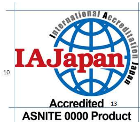
図3 ASNITE 製品認証機関の認定シンボル