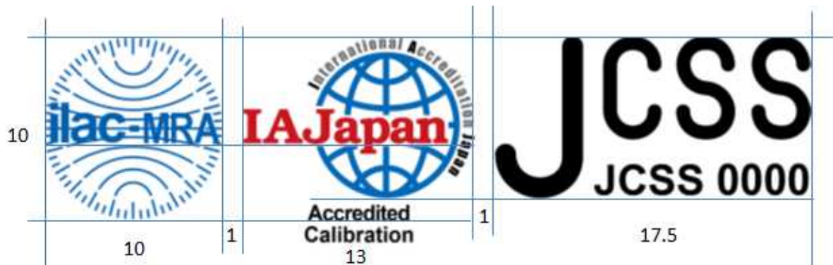
図6 JCSS/ILAC MRA 組み合わせ認定シンボル

IAJapanと認定契約を締結した認定事業者が使用できる認定シンボル及びMRA/MLA組み合わせ認定シンボルの使用例を図6から図12に示す。(図内数値は寸法比を表す)